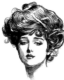
Anna (bohatá vdova)